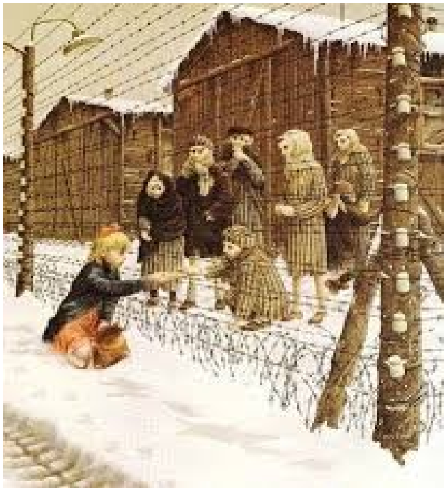
Dal libro "Rosa Bianca", di Roberto Innocenti

Alcune proposte di letture e di film dal catalogo della Biblioteca