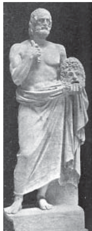
Euripide, Musei Vaticani

Orari biglietteria: lunedì, mercoledì, venerdì dalle 16 alle 19. Info: tel. 055 621894; www.archetipoac.it ; teatroantella@alice.it .